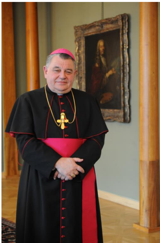
Dominik kardinál Duka

Přeji nám, všem členům a přátelům Kolpingova díla, hluboké a radostné prožití Velikonoc v jubilejním roce 2018.