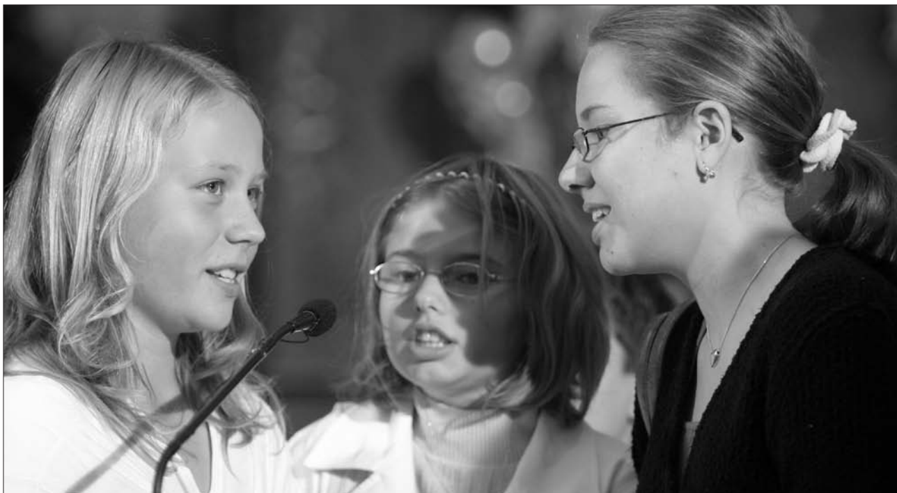
Autorky článku predikávají Korunku k Pražskému Jezulátku

V sobotu 26. 9. 2009 jsme odjely do Prahy na návštěvu Sv. otce Benedikta XVI. Tato návštěva se konala u Pražského Jezulátka v kostele Panny Marie Vítězné. Zde se měl Sv. otec setkat s rodinami a s dětmi z Pražské diecéze, ale nakonec mezi vyvolenými byla i skupinka ze Žďáru.